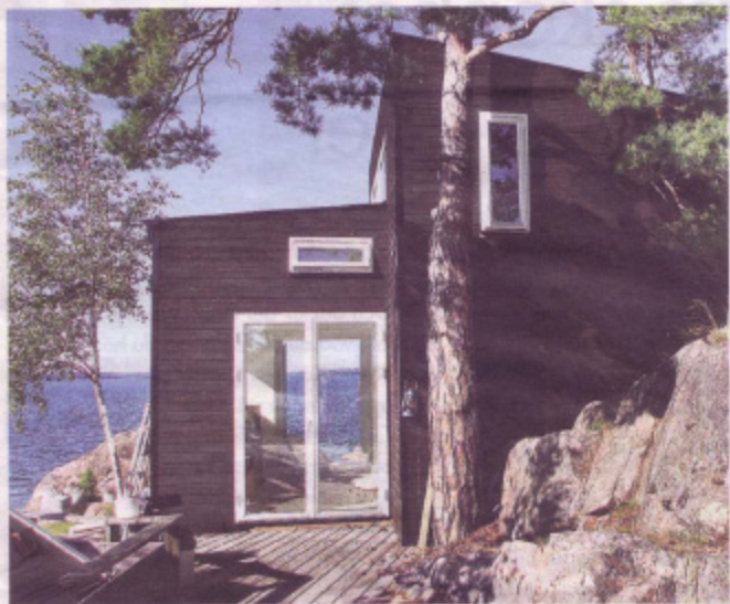
Litet skärgårdshus målat med svensk slämfärg, Falu rödfärg, som inte alltid behöver vara rött.